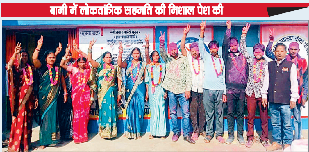
बामी में लोकतांत्रिक सहमति की मिशाल पेश की

जिले में त्रिस्तरीय पंचायत आम निर्वाचन 2025 के तहत कई ग्राम पंचायतों में निर्विरोध निर्वाचन संपन्न हुआ है। जिसमें कई स्थानों पर प्रत्याशी निर्विरोध निर्वाचित हुए हैं। जनपद पंचायत सहसपुर लोहारा में इस बार 3 ग्राम पंचायत और एक जनपद क्षेत्र में मतदाताओं ने धन-बल के बजाय आपसी सहमति और सामूहिक निर्णय से पंचायत चुनाव की प्रक्रिया पूरी की गई है। लोकतांत्रिक व्यवस्था का मजबूत उदाहरण पेश करते हुए जनपद पंचायत सहसपुर लोहारा क्षेत्र में 1 जनपद सदस्य और 3 सरपंच निर्विरोध चुने गए। निर्विरोध निर्वाचन से यह स्पष्ट होता है कि कई क्षेत्रों में मतदाता सहमति और आपसी सामंजस्य के आधार पर जनप्रतिनिधियों का चयन कर रहे हैं। ग्रामीणों से मिली जानकारी के अनुसार चुनाव में आपसी प्रतिस्पर्धा के कारण मत-मुटाव की स्थिति निर्मित हो जाती है, इसे रोकने के लिए यह सर्व सम्मति से निर्णय लिया गया है। ग्रामीणों ने निर्वाचित जनप्रतिनिधियों को शुभकामनाएं दीं। जनपद पंचायत सहसपुर लोहारा क्षेत्र के पंचायत रिटर्निंग अधिकारी ने बताया कि सहसपुर लोहारा विकासखण्ड