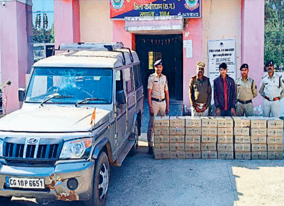
हरिभूमि न्यूज कुकदूर

शराब की अनुमानित कीमत 2 लाख, वाहन की कीमत 4 लाख कुल 6 लाख जब्त